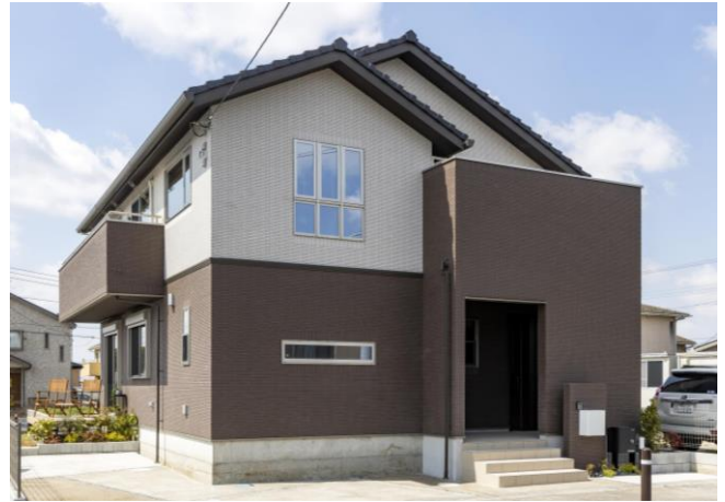
モデルハウス外観