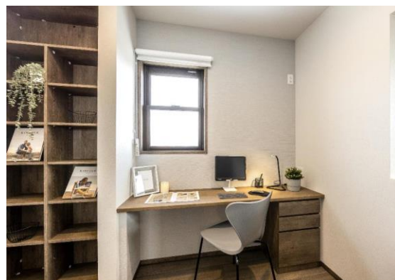
キャビネット付のデスクカウンターと本棚収納を備えた約2.7帖のワークスペース。オンライン会議なども集中できます。