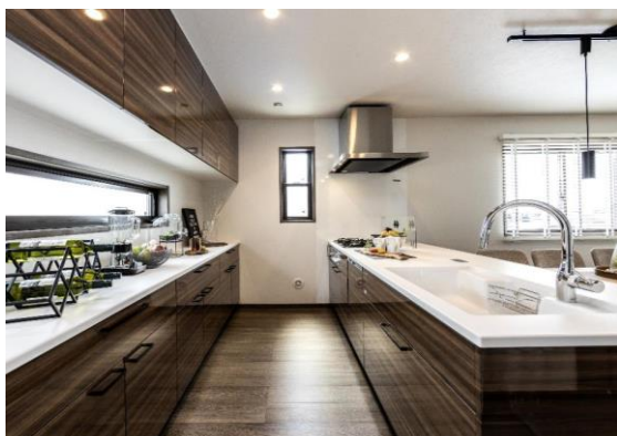
明るい空間で料理ができる開放的なオープンキッチン。リビングにいる子供に目を配りながら家事もでき、家族との会話も弾みます。