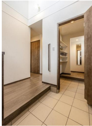
吹抜けのある玄関は、シューズクローゼットを経由してホールにつながる家族用の動線を確保。