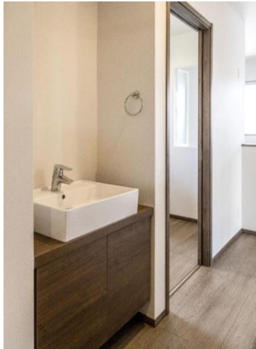
2階ホールにも手洗いスペースを設置。2階で水を使う動線が短くなり便利です。