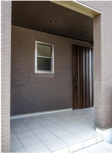
約4帖の広さを確保した屋根のあるゆとりの玄関ポーチは、雨の日も濡れません。

コミュニケーションを大切にしたいLDKは、家族みんながゆったりくつろげる約20.5帖の広さを確保。開放感のあるオープンキッチンは、家族全員で食事の準備や後片付けがしやすくなります。また、リビングとつながるウッドデッキは、オープンエアの心地よくつろぎを演出します。