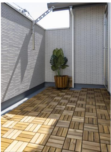
約4帖の広さを確保したプライベートバルコニーは、屋外でもプライバシーが守られます。