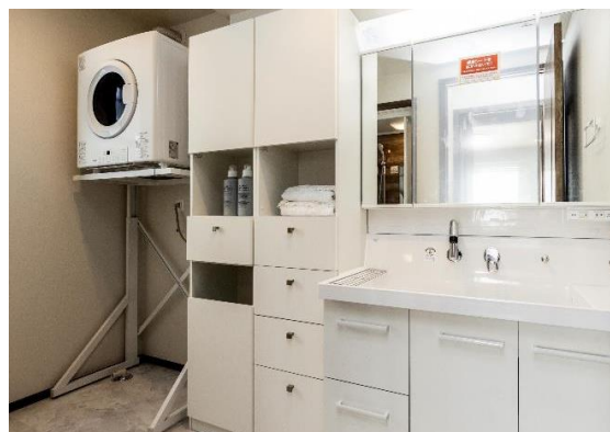
混雑しがちな朝も家族みんなで身支度できるゆとりのサニタリールーム。ガス衣類乾燥機を備え、洗う、干す、仕舞うを1箇所を実現します。