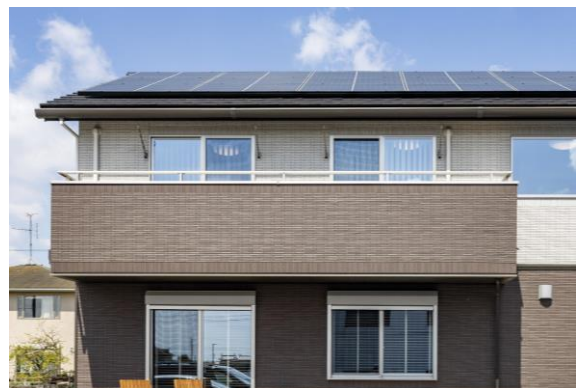
モデルハウス外観

塗り替えや貼り替えといった将来的な修繕費が抑えられ、メンテナンスコストを大幅に削減することができます。