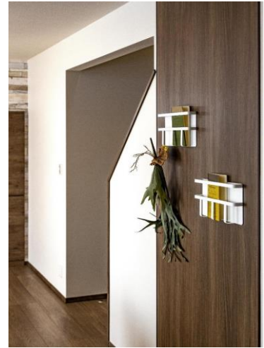
LD内の壁面にマグネットボードを採用。お子様の学校からのお便りを掲示することができます。