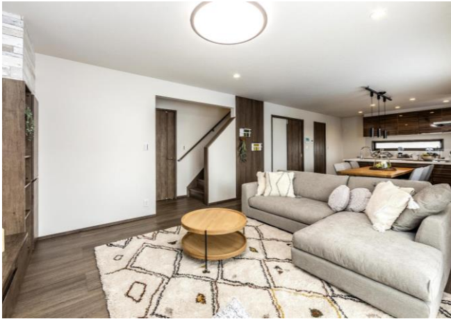
モデルハウス内観