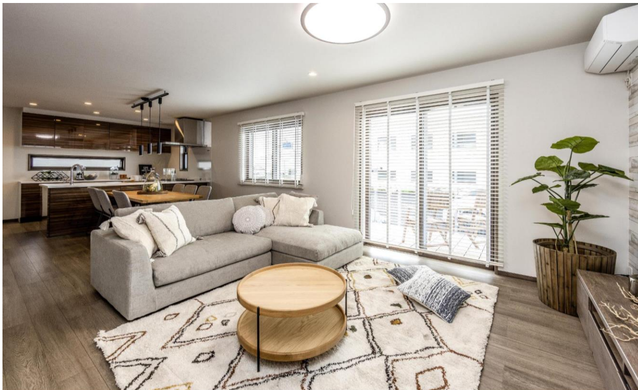
モデルハウス内観

同モデルハウスは、原材料の高騰による様々な値上げで家計への負担が増えていることから、光熱費やメンテナンスコストを抑える工夫が施されています。また、共働き世代の子育てを応援する間取りや動線の採用、家事の効率化＝タイムパフォーマンスを意識した間取り・設備・仕様を採り入れるなど、ウィザースガーデンが考える「将来に渡りご家族が心から安心して暮らせる等身大の住まい」を体感することができます。